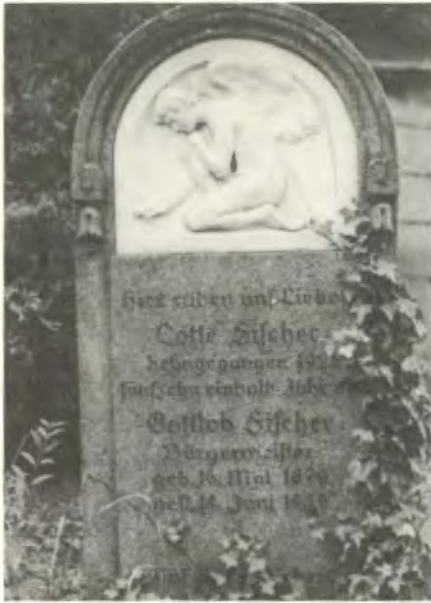
Der Grabstein der Familie Fischer