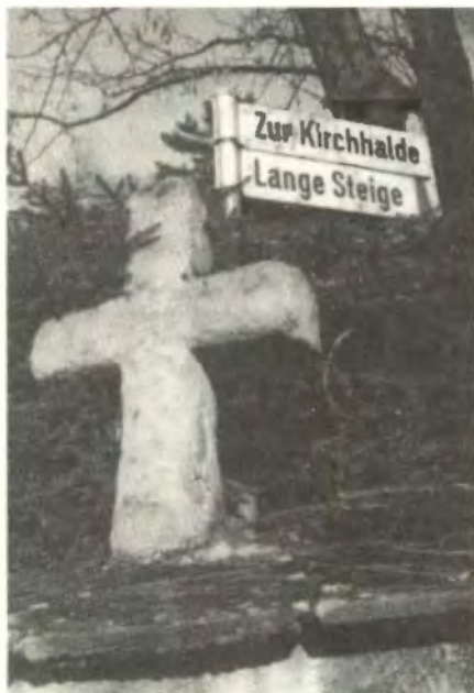
Sühnekreuz auf der Friedhofsmauer

Vier Friedhöfe hat Waldenbuch in den Jahrhunderten besessen, die wir überblicken können. Der älteste Friedhof befand sich auf dem Stadthügel um die Kirche herum. Als man den Platz dort oben brauchte, um den Schloßbau zu erweitern und das Kirchenschiff um den Turm nach Osten zu drehen, wurde unser alter Friedhof als der neue Friedhof vor die Mauern der Stadt verlegt, dorthin, wo die Schweizer Straße von Echterdingen kommend den Abstieg hinter