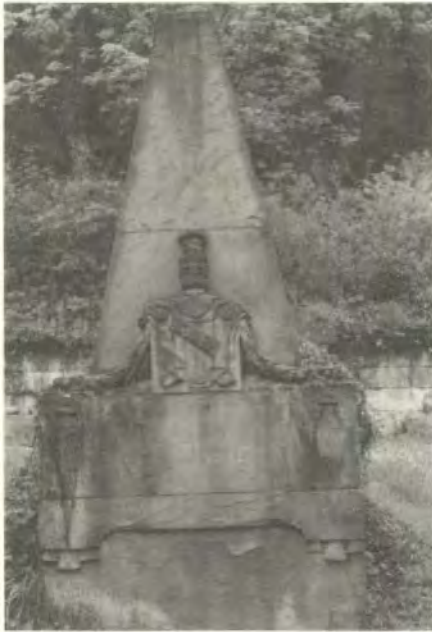
Das Grabmal des Herrn von Roeder

Der Stein zerfällt. Die Schrift bröckelt in Platten ab. Bald werden die letzten Zeilen gar nicht mehr lesbar sein. Dieser Mann war 1728 in Weimar geboren worden und schon 1750, also 22jährig, zum Oberforstmeister des Schönbuchs mit Sitz in Waldenbuch ernannt worden. Diese rasche Beförderung – sagten böse Zungen – verdankte er einer intimen Beziehung seiner hübschen Frau zu Herzog Karl Eugen. Für den Wahrheitsgehalt dieses Gerüchts mag sprechen, daß der Herr Oberforstmeister ohne großen Ehrgeiz, freundlich und gelassen bis zu seinem Tod auf dieser Stelle blieb. Die Waldenbacher schätzten diesen gemütlichen Thüringer, der zu leben wußte und andere leben ließ, schreibt Springer in seiner Chronik. Nur der Herzog war mit