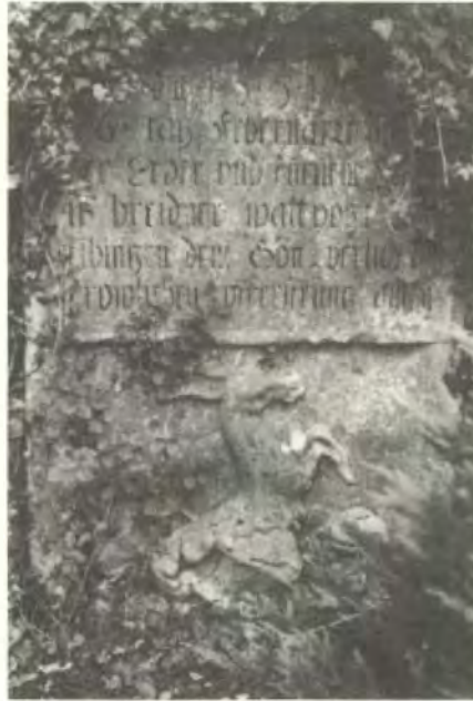
Die Grabplatte des Waldvogts E. Breitner

Der Stein zerfällt. Die Schrift bröckelt in Platten ab. Bald werden die letzten Zeilen gar nicht mehr lesbar sein. Dieser Mann war 1728 in Weimar geboren worden und schon 1750, also 22jährig, zum Oberforstmeister des Schönbuchs mit Sitz in Waldenbuch ernannt worden. Diese rasche Beförderung – sagten böse Zungen – verdankte er einer intimen Beziehung seiner hübschen Frau zu Herzog Karl Eugen. Für den Wahrheitsgehalt dieses Gerüchts mag sprechen, daß der Herr Oberforstmeister ohne großen Ehrgeiz, freundlich und gelassen bis zu seinem Tod auf dieser Stelle blieb. Die Waldenbacher schätzten diesen gemütlichen Thüringer, der zu leben wußte und andere leben ließ, schreibt Springer in seiner Chronik. Nur der Herzog war mit