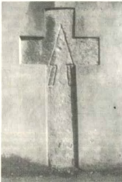
Ein Sühnekreuz mit Pflugschar – eingemauert am Eingang vom Alten Friedhof

Damals gehörten Sühnekreuze zu den üblichen Rechtsgepflogenheiten und stellten eine Form der Ahndung von Totschlagdelikten dar. Aus Herrenberg ist uns ein Vertrag aus dem Jahr 1474 überliefert, der illustriert, was alles sich mit den Sühnekreuzen verband: Neben einer Geldsumme an die Hinterbliebenen des Opfers mußte der Täter »zu trost und Heyl des erslagen sele in der Marck zu Heremberg setzen ein steinin Creutz« und zwar »sechsschüchtig« (ein Schuh, das waren damals 30 cm) hoch und »dreischüchtig« breit. Am Tag der Aufstellung des Kreuzes mußte der Verurteilte für eine Prozession von dreißig Personen sorgen, die alle brennende Kerzen tragen und jeweils vier Heller