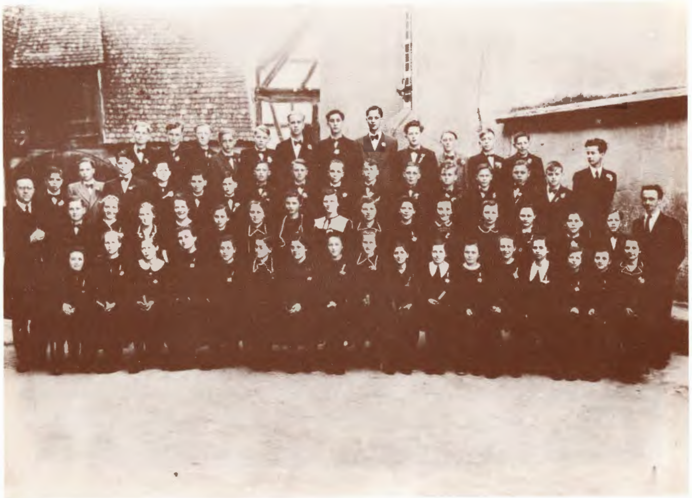
Unsere Konfirmation 26. März 1950