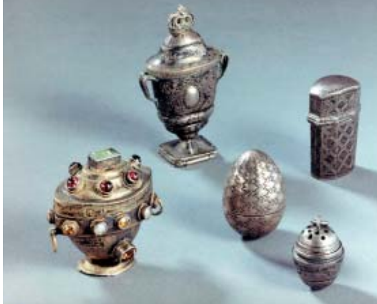
Abbildung 1: Wertvolle Riechdöschen und Arzneibehälter aus dem 17. und 18. Jahrhundert

Auch die Homöopathie ließ der Sammler nicht unbeachtet. Ein kleines Porzellangedeck mit Goldrand, ebenfalls