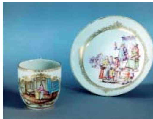
Abbildung 2: Die Tasse stellt einen Apotheker in seiner Offizin dar. Als Kontrastprogramm zeigt eine nicht zugehörige Untertasse aus Meißen Porzellan, entstanden 1724, einen Quacksalber bei seiner Arbeit.

aus Meißen stammend, diente der Einnahme von »homöopathischem Café«, wie die Aufschrift verrät. Eine sehr schön erhaltene Taschenapotheke in Form eines