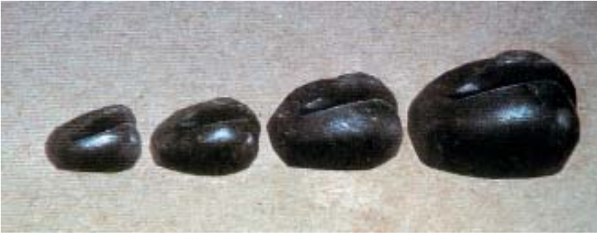
Abbildung 2: Gewichtssatz aus Hämatit-Enten aus der Zeit um 1740 vor Christus. Irak-Museum, Bagdad

eine Ente aus Magnetit. Sie wurde im Palast des assyrischen Königs Adadnirari III. in Ninive/Kujundschi (Nordostirak) entdeckt, trägt fünf Striche (5 mal 1000,0) und wiegt 4,99 kg. Ihre Inschriftenkartusche verrät: »5 manû, geeicht, aus šadanû-Stein, von Nergal-Ilaya, dem turtannu und Oberbefehlshaber, aus den Bergen Mediens...Silber... Haus von Ninive...gab ich«.