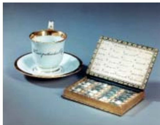
Abbildung 3: Die Porzellantasse mit der Aufschrift »Homöopathischer Café« stammt aus Meißen aus der zweiten Hälfte des 19. Jahrhunderts. Die homöopathische Taschenapotheke soll Samuel Hahnemann gehört haben.

Buches aus grünem Leder mit Goldprägungen soll aus dem Besitz des Begründers der Homöopathie, Samuel Hahnemann, stammen; er soll sie in seinen letz-